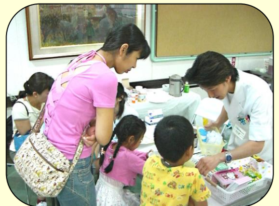
大好評の中原分院「医療祭」、今年も開催します。