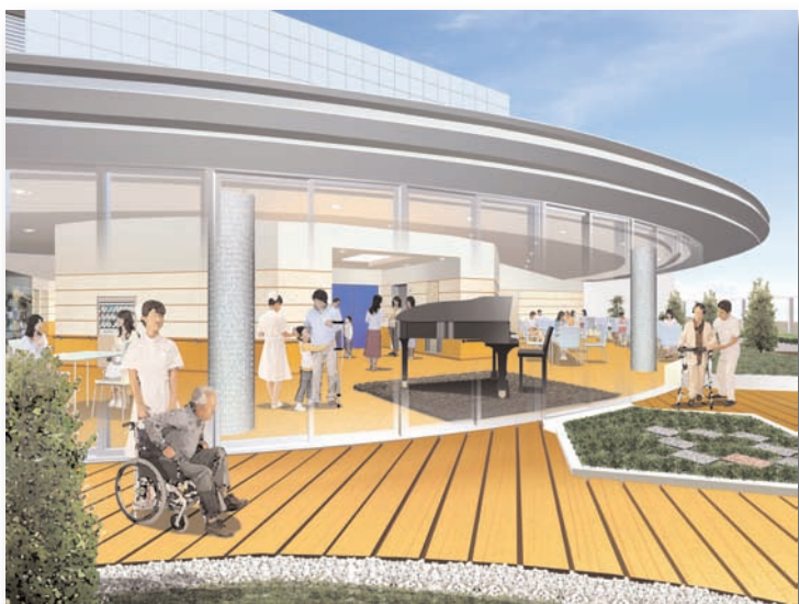
〈11階屋上よりラウンジを臨む〉

次号からは、これらのコンセプトを念頭に、各機能のご紹介をしていきたいと思えます。